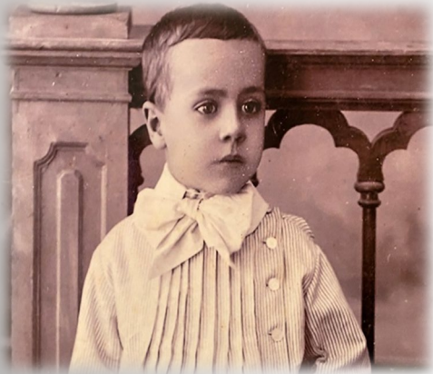
Imagen tomada de la exposición de la Fundación Juan Negrín