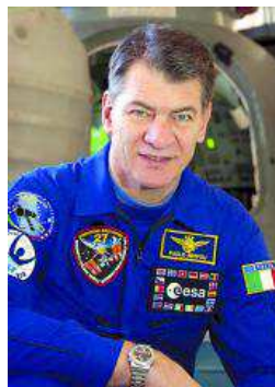
Paolo Nespoli.

En esta ocasión, y coincidiendo con el primer aniversario de ISS Contact 2011 que organizó con gran éxito nacional e internacional el Instituto universitario, el encuentro entre Nespoli y los 20 estudiantes que hablaron con él en esa conexión podrá ser personal.