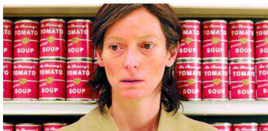
Tilda Swinton en 'Tenemos que hablar con Kevin'.