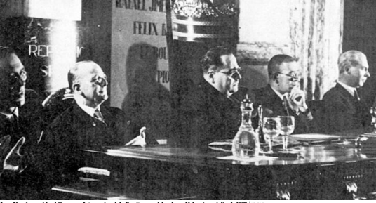
Juan Negrín preside el Congreso Internacional de Escritores celebrado en Valencia en julio de 1937.