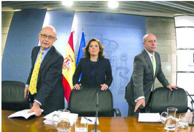
Cristóbal Montoro (L.), Soraya Sáenz de Santamaría, y el ministro de Educación, José Ignacio Wert, ayer.

El ministro constató los recursos públicos crecientes dedicados y la extensión y generalización de la educación superior en los últimos años, con niveles